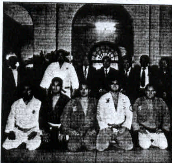
□ Los judokas se beneficiarán con esta donación.